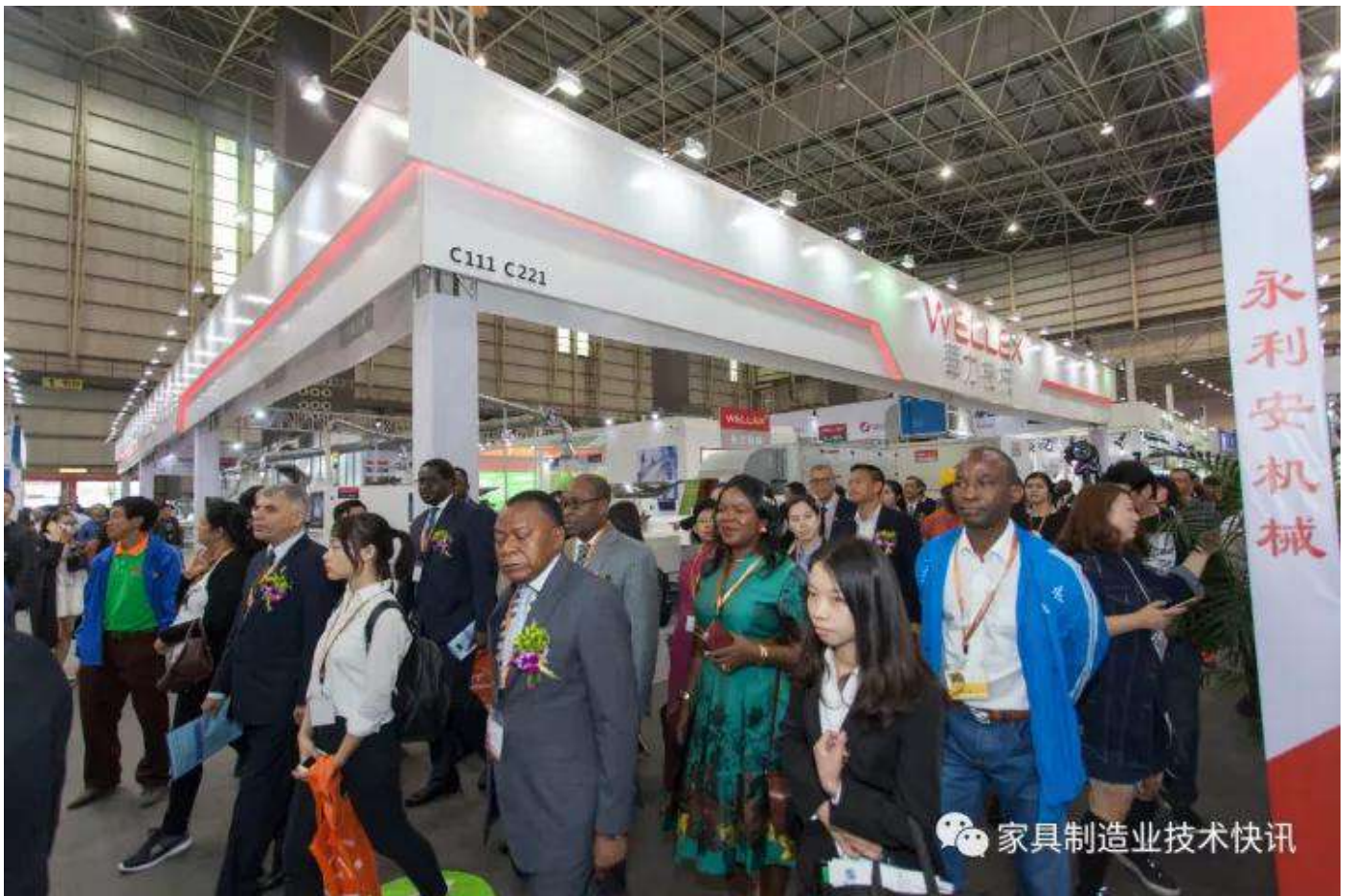
各领导嘉宾参观展会