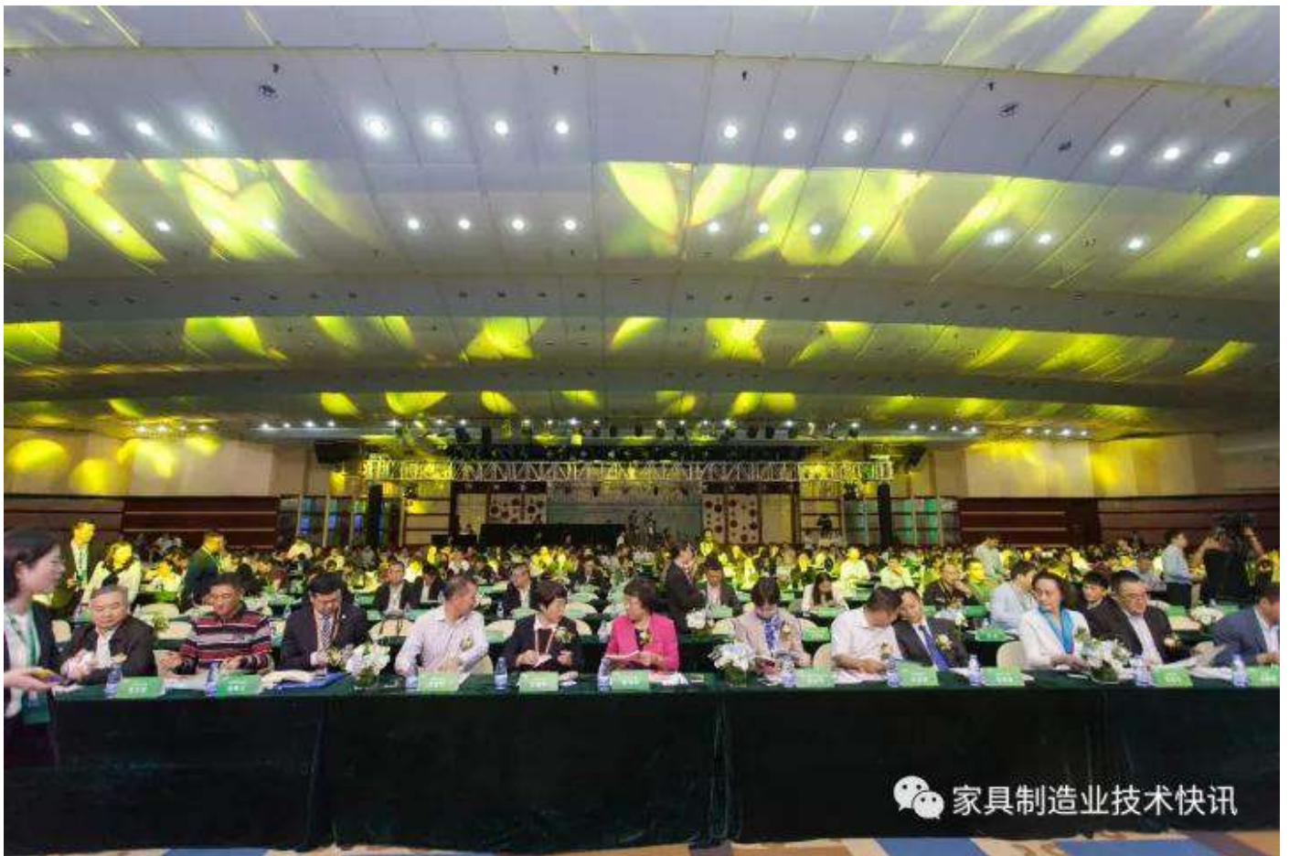
展会汇集家具行业 新设备、新材料、新技术、新思想 展会期间活动精彩不断